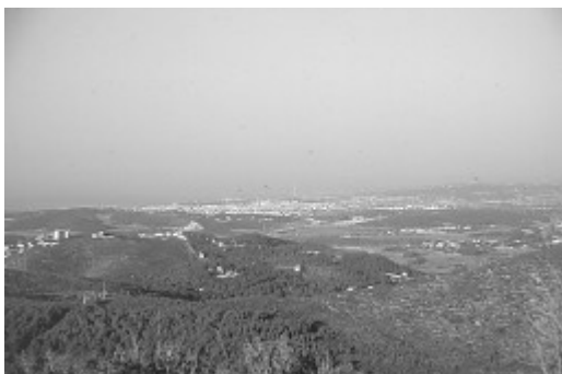
Vilanova i Cubelles des de Pota de Cavall

mig de la riera, encara sota els Masets. Agafem el de l'esquerra, una pista franca que comença pujant fort, i encara marcat com a GR 5. Passat un gran pi, hi ha una explanada, i les runes del Maset de Dalt . Aquí menjarem coca i moscatell.