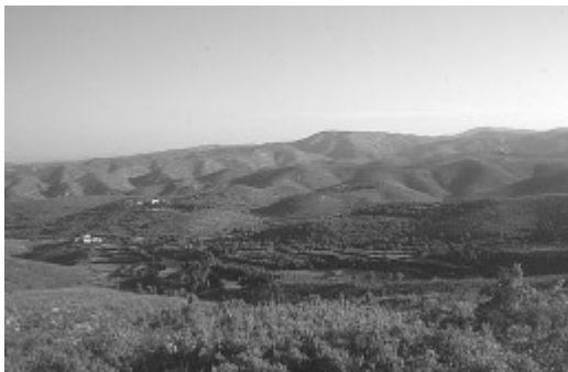
El Garraf des de Pota de Cavall

Sempre pel senderó, després d'un llarg planeig entre formacions arbustives, arribem al coll de Pota de Cavall (210 m.). Des de dalt, un corriol a la dreta baixa fins a Can Marcer. Continuem recte, sense abandonar el nostre camí. Un darrer ascens i un petit planeig ens menaran fins al començament d'una llarga baixada, en la que fins i tot podrem veure a l'esquerra el mar de Vilanova i la Geltrú i Cubelles. A la baixada caldrà parar compte, especialment si hi ha humitat, ja que la pedra és força desfeta i relliscosa.