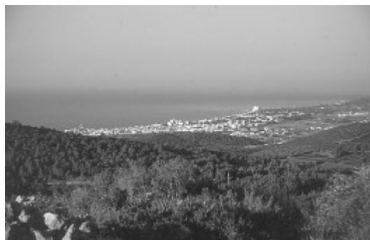
Sitges des del Coll d'Entreforc

Ens trobem, com sempre, a la plaça Catalunya . Comencem a pujar pel Camí de la Fita . Deixem a la nostra esquerra el col·legi Miquel Utrillo i l'Institut Joan Ramon Benaprés. Un cartell ens informa que aquí comença el sender de Gran Recorregut GR 5, en el tram de Sitges a Montserrat (64 km.). Els senyals blancs i vermells del GR ens acompanyaran uns quants quilòmetres. Continuem cap al NE, i passem, encara per l'asfalt, sota l'autopista C-32, en direcció al nou polígon del Camí de Mas Alba.