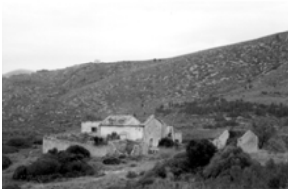
Les runes de la Casa Nova

per Penya Riscla i el Camí de la Fita. Precisament, el tram final de la caminada segueix aquesta darrera ruta. Continuem la pista cap a l'esquerra, i en poc més de mig quilòmetre passem pel Coll Roig , coronat per quatre pins.