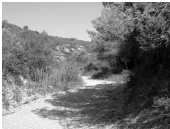
Entrada del Fondo d'en Figueres

També deixem a l'esquerra el trencall d'una dreuera que puja directament cap el coll de la Fita. Després de diverses esses, sempre seguint el llit del Fondo, arribem a una mena de plaça, on s'acaba la pista.