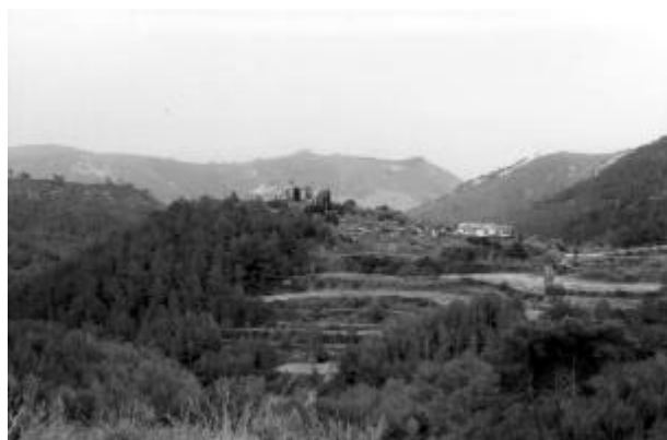
Mas Quadrell des de Penya Riscla

baixa cap a Vallcarca, també barrada per una cadena, i arriba a la corba de sota Penya Riscla . Aquest serà un bon punt per fer fotografies, sempre i quan les boires del massís