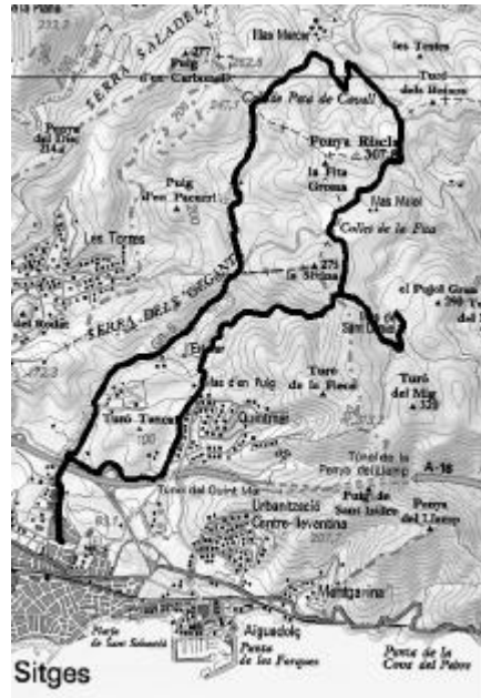
Mapa Garraf -17 (ICC)