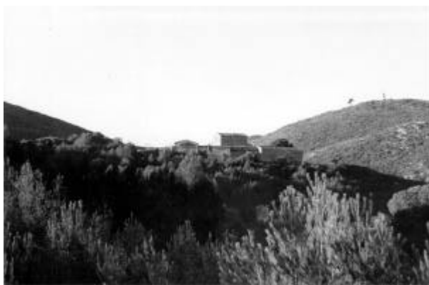
Vista inferior de Can Marcer

a Coll d'Entreforc , una masia amb un procés de restauració aturat des de fa temps. Des d'aquí, baixem a la nova pista, que seguim a la dreta, i que, breument, ens conduirà en lleuger ascens cap el Coll de la Fita, on veurem Sitges. Aquí retrobarem el Camí de la Fita , ara ja en baixada cap el punt de sortida. Just a la primera corba a l'esquerra, seguirem recte, per fer la dreuera que ens evita un pronunciat retomb de la pista, en aquest tram encimentat.