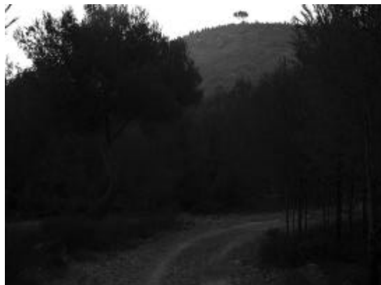
La Riera de Jafre, cruïlla de camins

A partir d'aquí, una ampla pista de terra compactat ens permetrà una llarga baixada de bones vistes sobre el massís que, després de passar sota una línia de corrent elèctric, ens menarà al costat de l'enrunada paret del Maset de Dalt. Seguim la baixada de la pista, fins que