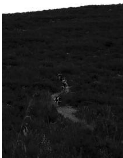
Matolls prop de Can Grau

La Ruta de Sitges a Montserrat és un dels camins de muntanya més antics i freqüentats que transiten pel nostre terme municipal. De fet, està documentat de fa més de 500 anys, quan ja s'hi feien peregrinatges. Amb el temps, el tram va ser marcat i descrit com un dels primers senders de Gran Recorregut de la xarxa catalana, mantingut per cuidadors voluntaris amb el suport de la Federació d'Entitats Excursionistes de Catalunya, amb la intenció que fes un semicercle al voltant de l'àrea de Barcelona, passant pels espais naturals més destacats.