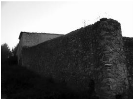
El Maset de Dalt

La masia de Can Grau de Cabrafic, actualment escola de natura i observatori astronòmic, està situada a un contrafort del puig de la Mola, un dels cims del Garraf, i vèrtex entre el Garraf, l'Alt Penedès i el Baix Llobregat.