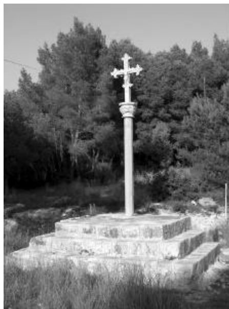
La Creu de Ribes

de les finques de la dreta, veurem l'ermita de Santa Bàrbara, que dóna nom a l'indret. El Camí ens deixarà a la recentment restaurada Creu de Ribes, que pels ribetans és de Sitges, ja que marca el límit de terme entre els dos municipis. Vorejarem la urbanització, fins trobar el caminet que careneja per sobre del bosc de Can Burguera, just pel límit de terme. En breu, seguirem un senderó que, pel mig del bosc, i ja en terme de Sant Pere de Ribes, ens mena a la pista que porta fins l'autódrom i la