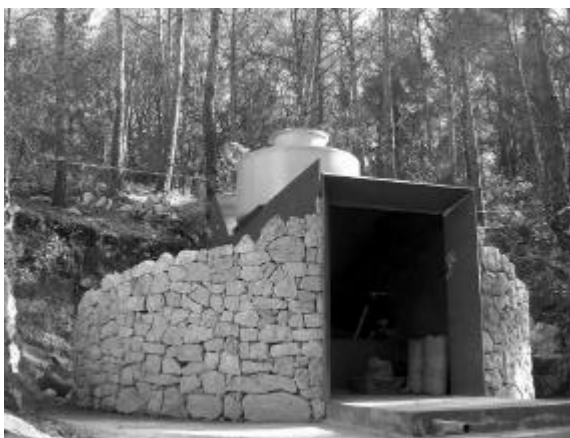
La Font de les Basses, encara en construcció

Arribats al coll, creuarem recte, i seguirem pujant pel camí del Gafarró, fins arribar a aquest punt de reunió d'un grup d'Amics del Garraf. En breu, trobarem una cruïlla, i seguirem a l'esquerra, per baixar, per la vora d'un camp de conreu, fins la pista de la Trinitat. La seguim a la dreta, fins una altra cruïlla propera, i anem a l'esquerra, de nou, en direcció a les Basses. Una mica