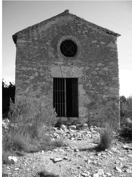
Ermita de la Mare de Deu de Gràcia

penya-segats. En una d'elles, la cova del Gegant, es van trobar els anys 50 restes prehistòriques. El camí és transitat en l'actualitat per estiuejants a la cerca de la platja nudista de l'Home Mort. A dalt de tot del primer penya-segat, girem a la dreta, per passar sobre les vies del tren i ascendir cap a un bosquet proper. El sender acaba baixant, i desemboca en l'inici del camí dels Colls, que va patir fa un temps una profunda netejada que gairebé va doblar la seva amplada.