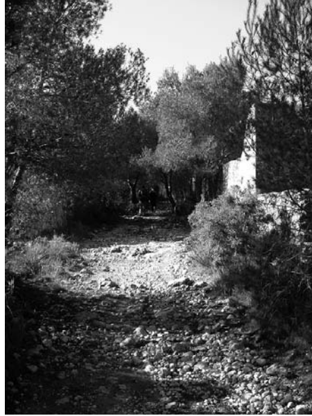
Camí de Santa Bàrbara

municipals de Sitges i Sant Pere de Ribes. Seguirem el camí 250 metres, fins girar a l'esquerra, on un corriol ens acostarà a la pista de l'autòdrom a carretera de Sitges a Sant Pere de Ribes, a l'alçada de la masia de Can Bruguera. Travessem la carretera, passem per les Torres, creuem per sota l'autopista C-32, i acabem a les Casetes, on girem a la dreta per un sender que, en pujada, ens torna a acostar a Sitges, sempre paral·lels a l'autopista. Passat un bosquet, ens trobarem amb els vials del polígon de les Pruelles. Baixem fins la rotonda d'entrada, que seguim a la dreta, per trobar-nos davant l'institut Joan Ramon Benaprés amb el Camí de la Fita, que ens conduirà al punt d'origen.